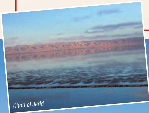
Chott el Jerid